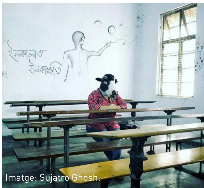
Imatge: Sujatro Ghosh.

Amb aquest objectiu, s'exposaran diversos casos de discriminació, la importància del context en el desenvolupament o no de totes les dimensions de la persona i algunes respostes, creatives en alguns casos, per a fer-los front. A més, es tractarà de guiar la reflexió de com JO puc ser una persona discriminada i ser agent de discriminació per a entendre els mecanismes que operen després de determinades conductes i comportaments.