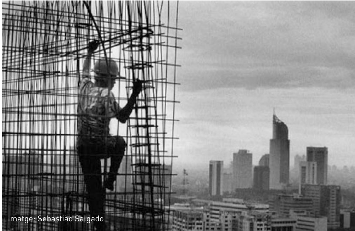
Imatge: Sebastião Salgado.