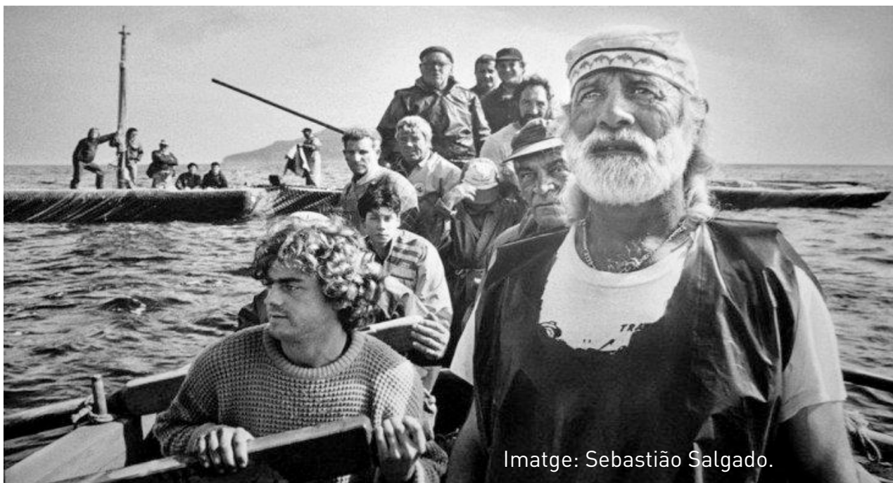
Imatge: Sebastião Salgado.

Dos reflexos d'un sistema globalitzat que situa el creixement econòmic i el control dels recursos i les zones geoestratègiques del planeta en el centre de les agendes, i els enalteix, alhora que priva a les persones i als ecosistemes dels seus drets vitals més fonamentals.